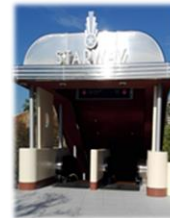
ユニバーサルグローブ (地球儀のオブジェ)