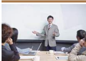
コーポレートミーティング