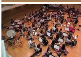
オーケストラの練習

あらゆる音楽ジャンルに対応し、上質な「音」を体感していただけることはもちろん、展示会、コーポレートミーティング等のご利用も可能な多目的ホールです。スタイリッシュかつシックな雰囲気でごコーディネートされたエントランスやハワイエもあわせてご利用いただけます。