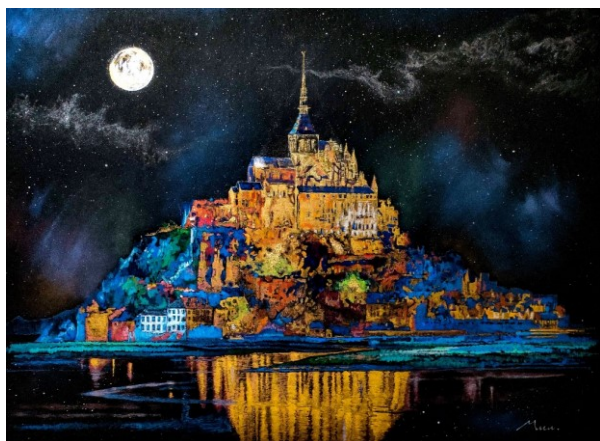
モンサンミシェル