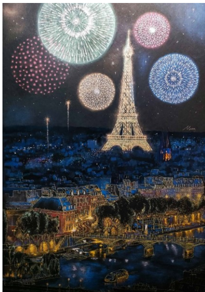
エッフェル塔と花火 Deluxe