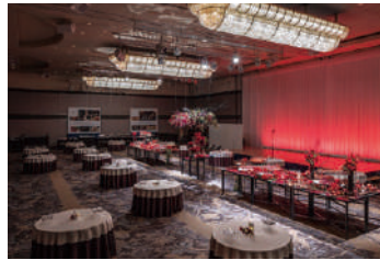
4F アートグランドボールルーム