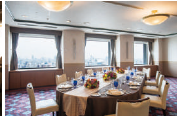
22F スカイバンケット VIPルーム