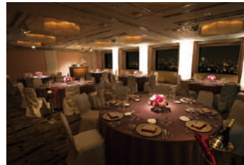
22F スカイバンケット イースト