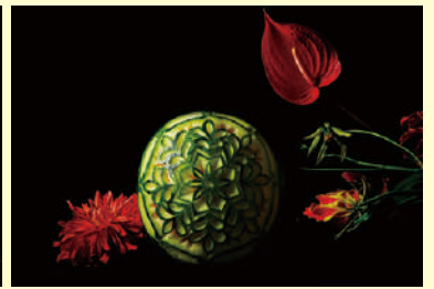
フルーツカービング「華麗なる西瓜アート」