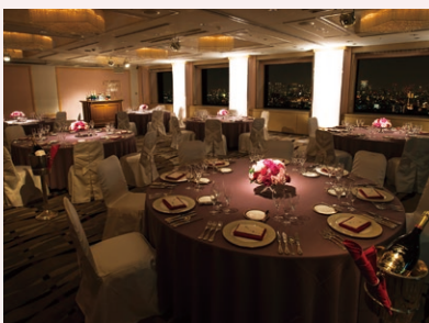
22F スカイバンケット イースト