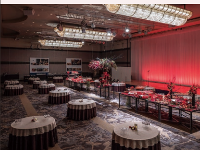
4F アートグランドボールルーム