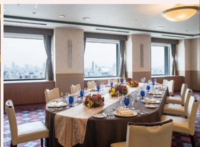
22F スカイバンケット VIPルーム