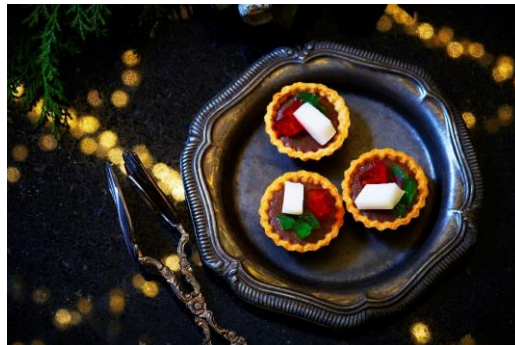
スプレンドーレ ～3色ゼリーのタルト～