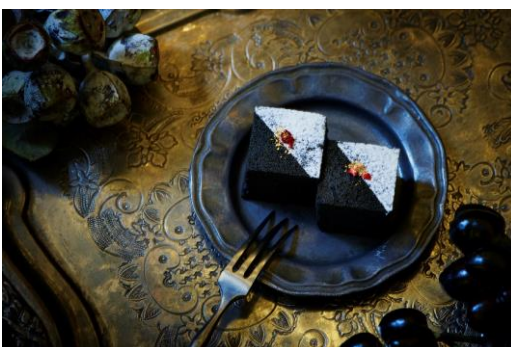
チッタ ～竹炭とドライ苺のフィナンシェ～