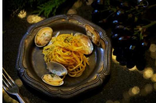
出来立てパスタ ボンゴレビアンコ