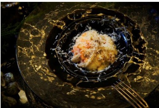
じゃがいものニョッキ サーモンクリームソース