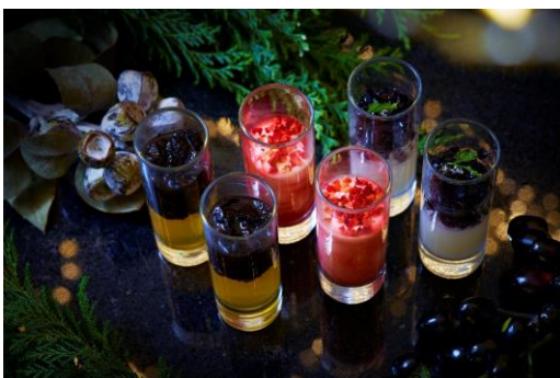
エ・デーボレ ～コーヒーゼリー・フロート～ アップシオナート ～バニラと苺のムース～ アンマリアンテ ～グレープランドーゼリー～