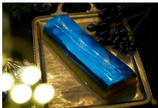
スペチャーレ・クレパスコロ