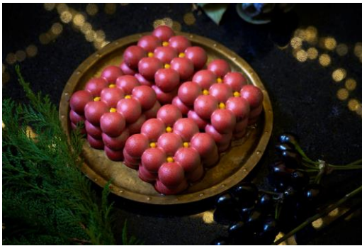
コロレ ～カシスムース～