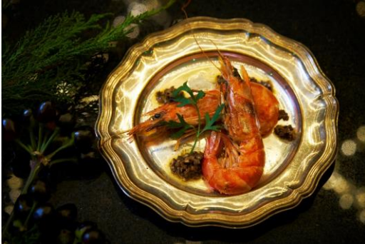
赤海老のグリル アンチョビソース