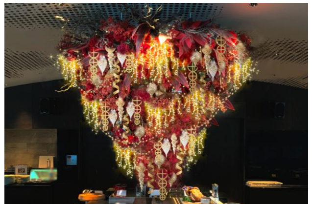
トリノ王宮（ビュッフェエリア）

トリノ王宮や他の宮殿などでみられるシャンデリアのように、豪華で美しい象徴的な姿で空間の主役として堂々たる存在感を放ちます。