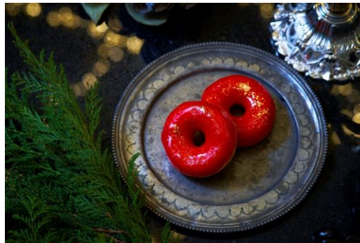
ナターレ ～苺のナパージュ・ドーナツ～