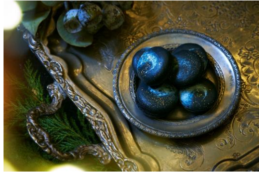
ステラ ～竹炭と塩ブラリネのマカロン～