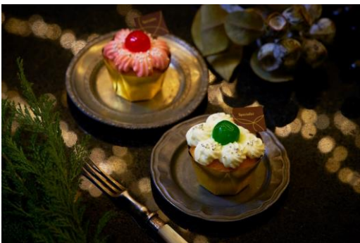
ジョイエレリア ～2色のカップケーキ～