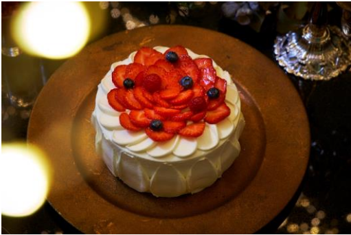
フィオーレ ～苺のデコレーションケーキ～