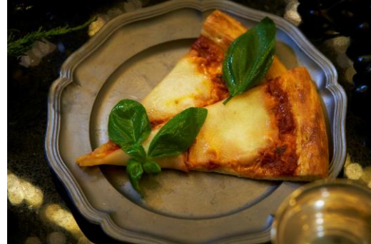
ピッツァ マルゲリータ