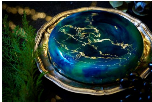
スメラルド ～青リンゴのムース～