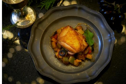
チキンの鉄板焼き シチリア風 (ランチ限定)