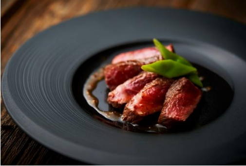
アンガーステーキ 赤ワインソース (ディナー限定)