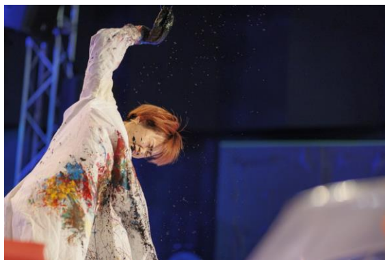
過去ライブペイントの様子

人生が動くのはいつもそんな瞬間だった。 その瞬間に湧き出たエネルギーを今回 アートホテル大阪ベイタワーの宴会場の一室に詰め込みます。